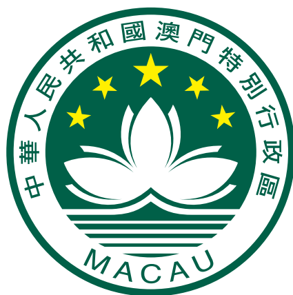
澳門特別行政區區徽圖案

方均勻排列「中華人民共和國澳門特別行政區」中文繁體區徽標準字樣，字下端朝向徽面中心點。文字區外圈下方均勻排列「澳門」葡文區徽標準字樣，字母上端朝向徽面中心點，中葡文字樣均以徽面的中軸線為準對稱分佈。徽面內圓中間繪有由三個花瓣組成的白色蓮花。位於蓮花上方的金黃色五角星一大四小，中置大五角星左右各有兩顆小五角星，五角星以徽面中心為圓心呈放射狀分佈，各星底角尖朝向徽面中心點。蓮花下方是白色大橋和綠白相間並由近向遠漸變的海水。