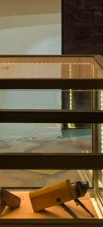
Exposição da Carpintaria de Lu Ban