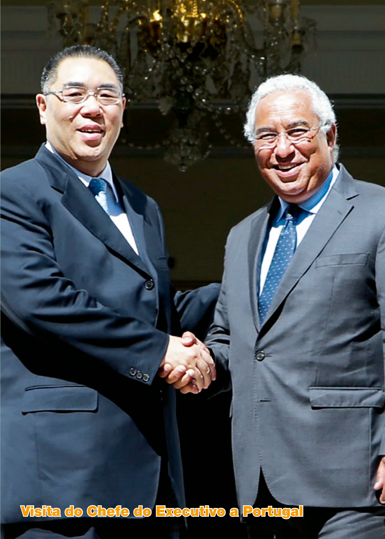
Visita do Chefe do Executivo a Portugal