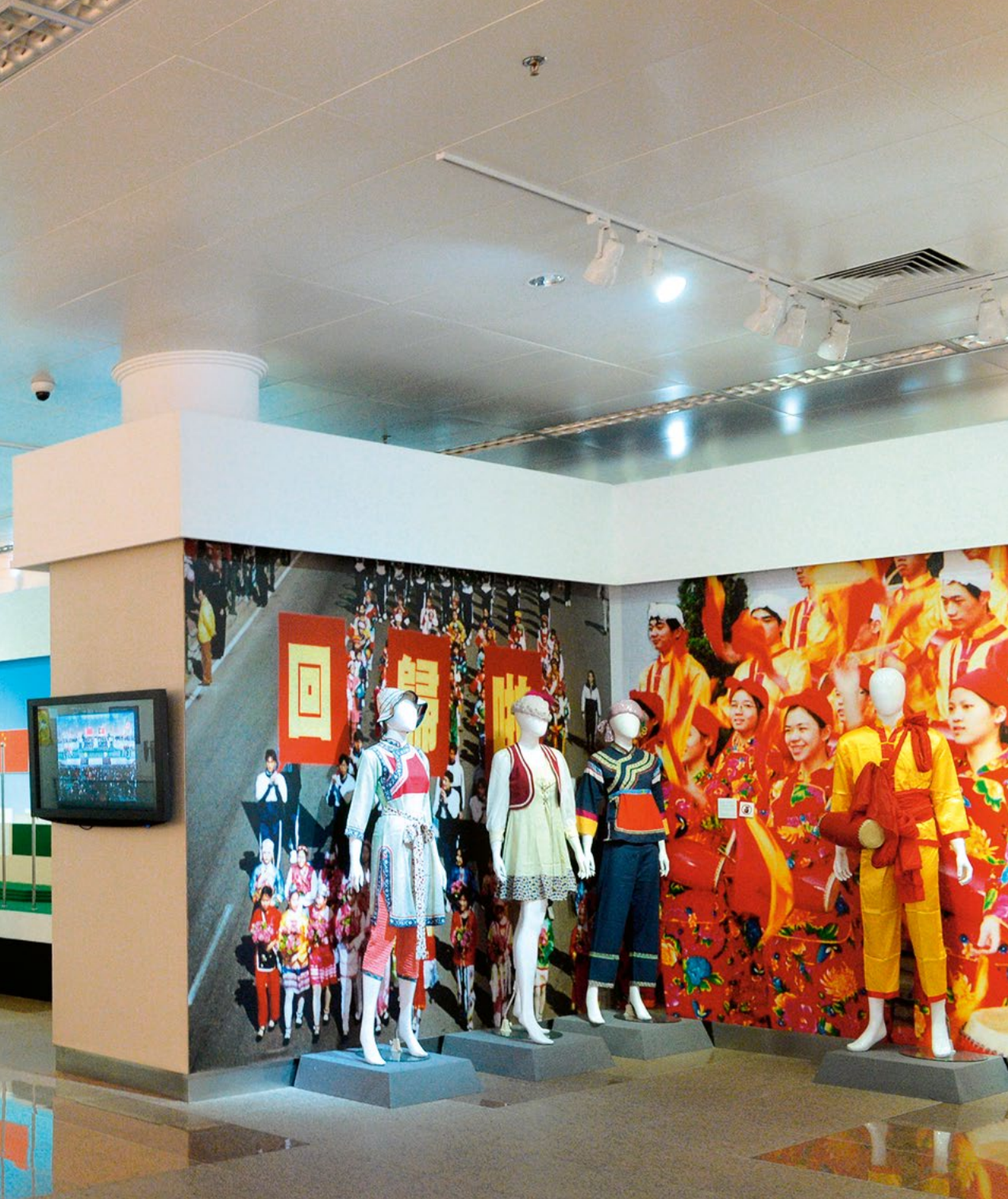
澳門基本法紀念館