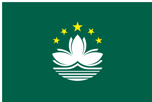
澳門特別行政區區旗圖案

澳門特區區旗的形狀、顏色兩面相同，旗上五星、蓮花、大橋、海水圖案兩面對。旗面為綠色，呈長方形，其長與高為三與二之比。旗面中間繪有由三個花瓣組成的白色蓮花。位於蓮花上方的金黃色五角星一大四小，中置大五角星左右各有兩顆小五角星，蓮花下方是白色大橋和綠白相間並由近向遠漸變的海水（第 6/1999 號法律附件二）。